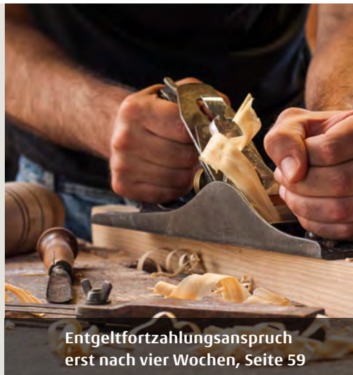
Entgeltfortzahlungsanspruch erst nach vier Wochen, Seite 59

Hinweis: Nach Redaktionsschluss können sich Änderungen ergeben!