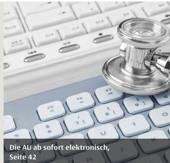
Die AU ab sofort elektronisch, Seite 42