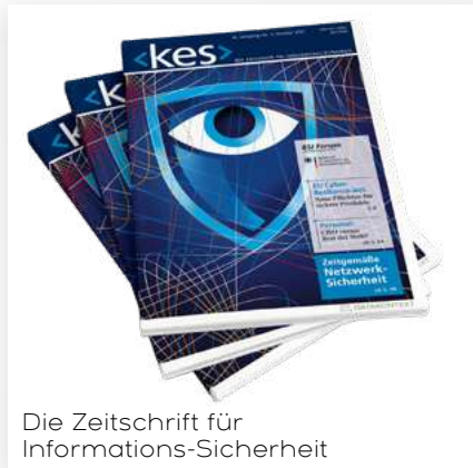
Die Zeitschrift für Informations-Sicherheit