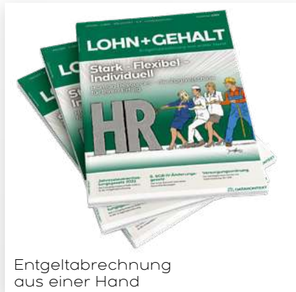
Entgeltabrechnung aus einer Hand