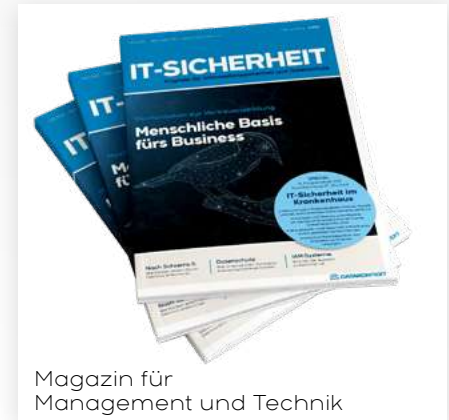
Magazin für Management und Technik