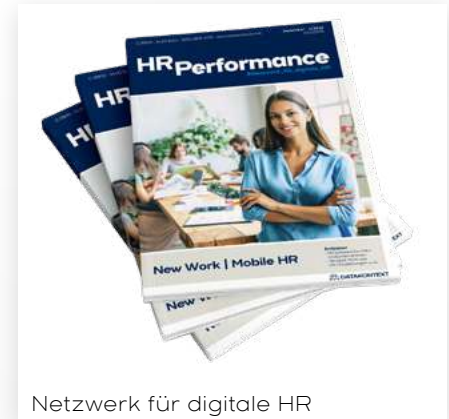
Netzwerk für digitale HR

DATAKONTEXT GmbH Augustinusstraße 11 A 50226 Frechen www.datakontext.com