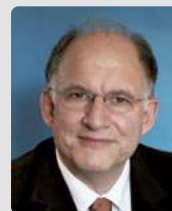
Peter Schaar Bundesbeauftragter für den Datenschutz und die Informations- freiheit a.D.